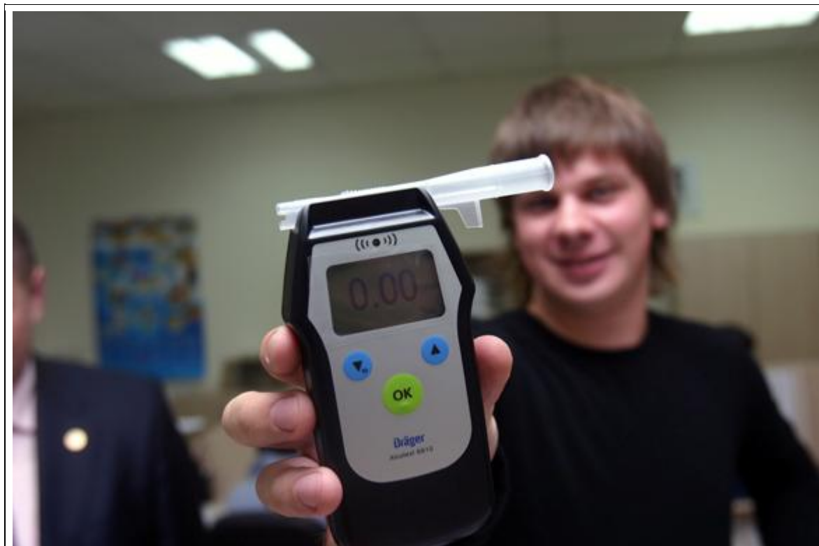
Результаты теста сильно зависят от организма. Одного и водка не берет, а другой от кваса пьян

Я взял на себя народные 50 граммов водки. Весу во мне — 77 кг. Через пять минут мог садиться за руль — 0,13 промилле. А через 10 минут прибор уже демонстрировал 0,00 промилле. «Еще в кровь не всосалось», — предположили эксперты. Но измерения через 20, 30 и 60 минут тоже показывали нули. Мой организм один «дринк» водки спрятал очень надежно. «По нулям, но координация-то нарушена», — подшучивали коллеги.